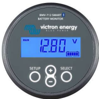
Sensor Bluetooth: Monitor de baterías BMV-712 Smart