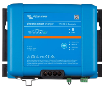
Cargador Smart IP43 12/50(3)