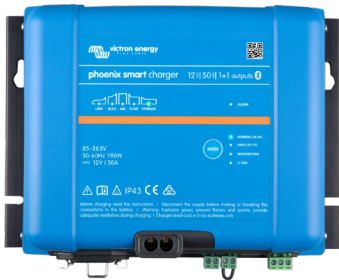
Cargador Smart IP43 12/50(1+1)