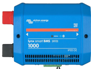
Lynx Smart BMS 1000 A