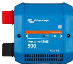
Lynx Smart BMS 500 A