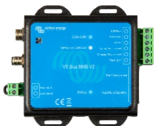
VE.Bus BMS V2