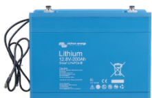
Lithium Battery Smart de 12,8 V y 25,6 V