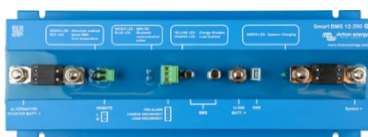
Smart BMS 12/200