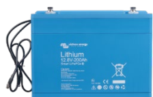
Lithium Battery Smart de 12,8 V y 25,6 V