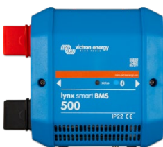
Lynx Smart BMS 500 A