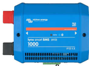
Lynx Smart BMS 1000 A