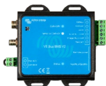
VE.Bus BMS V2