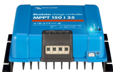
Controlador de carga solar MPPT 150/35