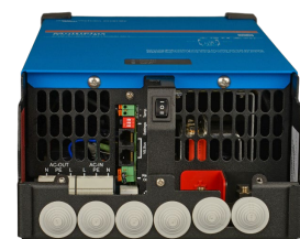
MultiPlus 2000 VA (sin la cubierta inferior)