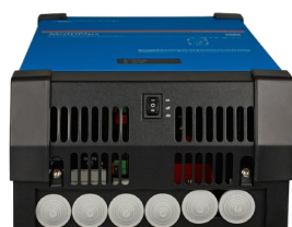
MultiPlus 2000 VA (with bottom cover)